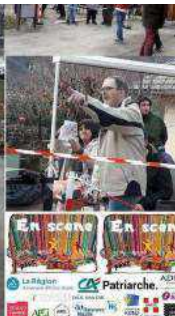
Au dessus : nous offrons un concert du groupe And'Joy pour les adultes du Fam de Saint Martin La Chambre