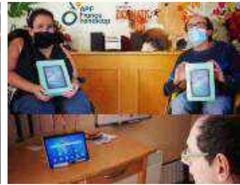
Nous avons également offert 14 tablettes numériques pour des foyers