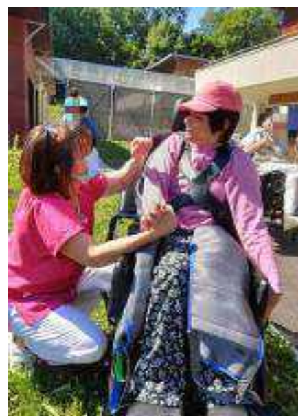
Un grand merci à tous les professionnels pour leur bel accueil à chaque fois