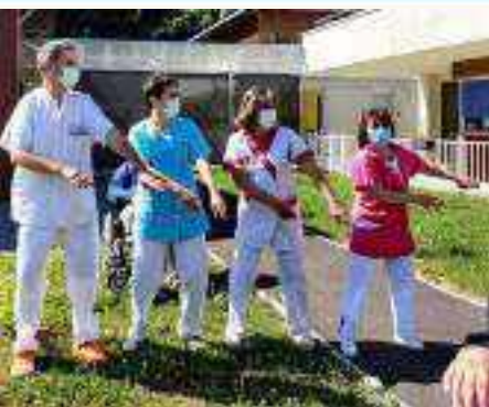
Une chorégraphie des plus endiablée à la Mas de La Motte Servolex