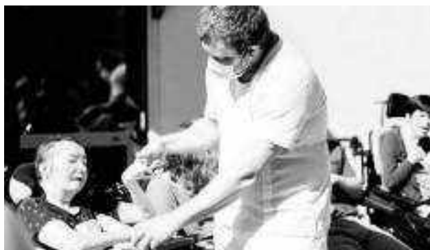
A gauche à la MAS de La Motte Servolex