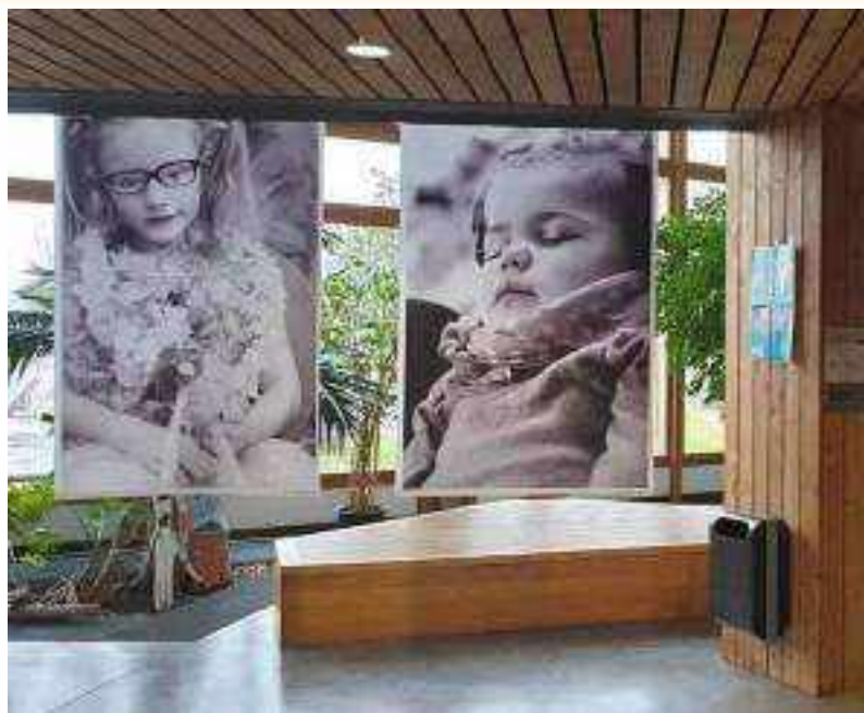
L'occasion pour certains élèves de travailler à distance sur ces visuels . Merci à Gaëlle la super maîtresse