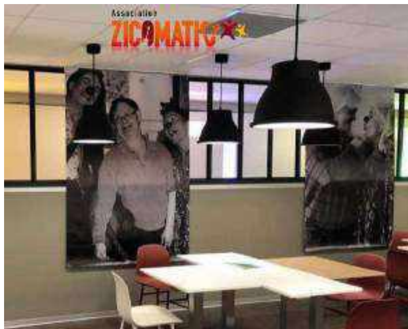
Ci dessus : la salle du réfectoire du siège du Crédit Agricole d'Ile de France qui accueille notre expo en Novembre