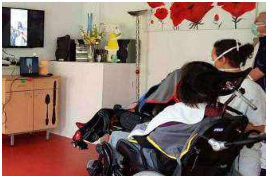
A droite, le groupe Elipsis diffusé au sein du foyer le Goéland à Meythet en Haute- Savoie

Ces lives ont été suivis dans de nombreuses structures pour personnes handicapées, d'un jardin, sur un balcon, dans une chambre et tous les lieux possibles. Un grand merci aux professionnels qui ont organisé les diffusions et les familles de chez eux.