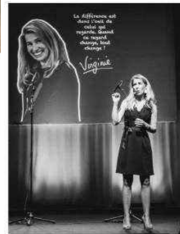
Virginie Delalande, première avocate sourde de France