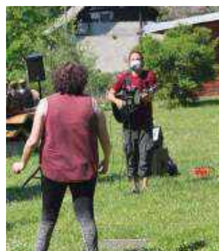
Quand la musique s'invite dans les foyers, même les voisins en ont profité et parfois participaient