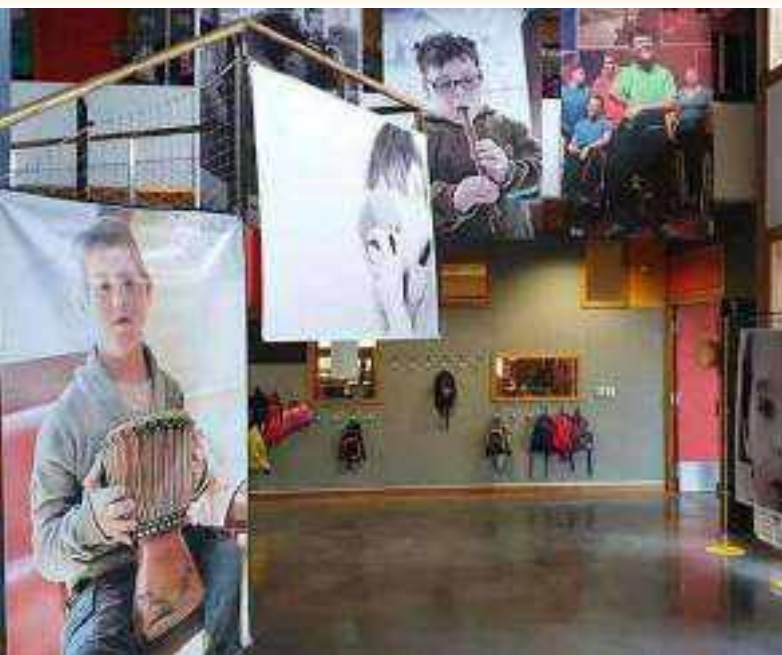
Notre exposition a été confinée au sein de l'école de Challes-Les-Eaux