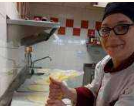
Etudiants et professionnels de l'AFPA DE POISY nous font l'amitié d'aider