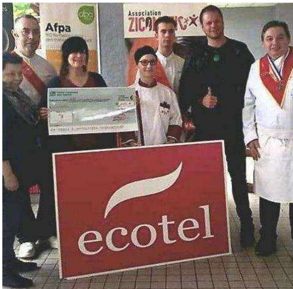
Remise de chèque à notre association suite à la vente de nombreuses galettes en Janvier