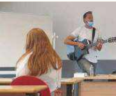
La musique et les compositions de Zicomatic comme supports ludiques à la sensibilisation