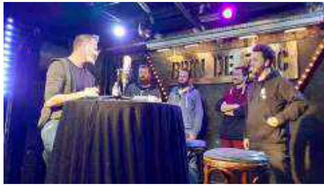
Dernier jour en direct du BRIN DE ZINC nous avons invité 4 associations sur le thème du handicap pour les mettre en avant