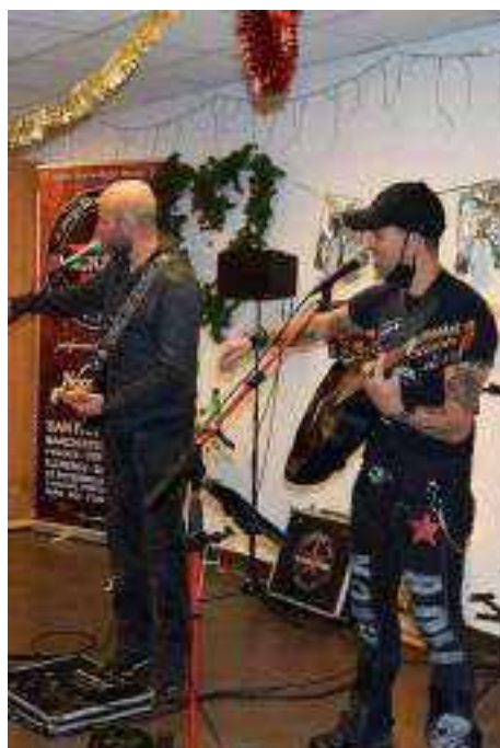
A gauche : en duo à Aix-les-Bains avec Blackstage

Malgré les difficultés nous avons pu offrir aussi des concerts en présentiel dans certaines structures pour des petits comités parfois Au dessus : le duo Père Et Fils Hakuna Matata pour les adultes des Iris à La Balme de Sillingy