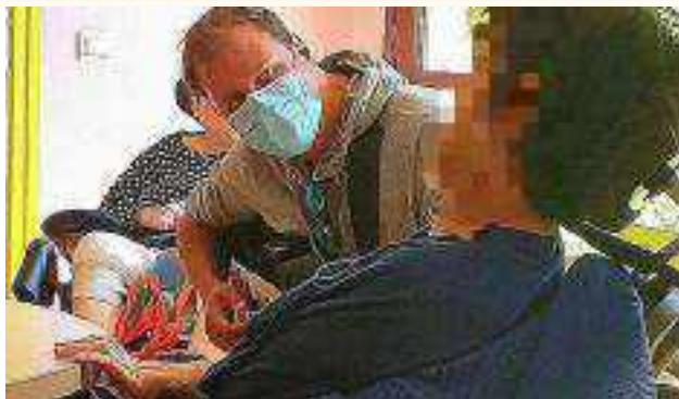
En maison d'accueil spécialisée