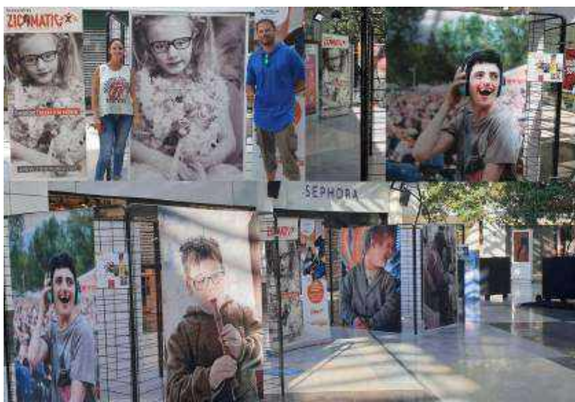
En dessous : Centre Commercial Courier Annecy