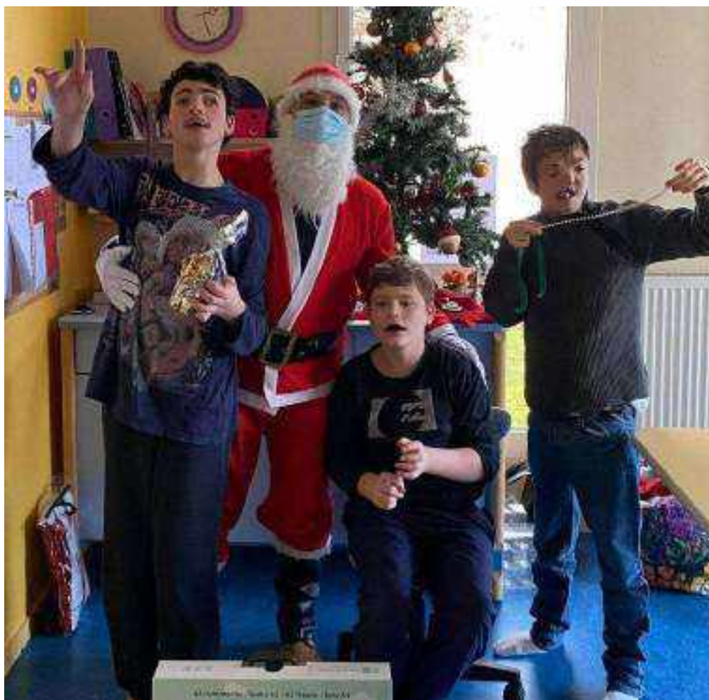
Le père Noël de Zicomatic s'est invité aux Mésanges pour les enfants

Nous avons pu offrir un après-midi de tours de calèche accompagné du père Noël, de nombreux cadeaux et un concert dans chaque unité de Théo Dubois, chanteur du groupe DUMB LUCK