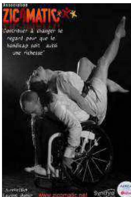
Ci dessus : L'exposition au sein de l'AFPA de POISY