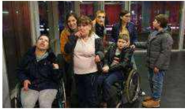
Accueil de nos amis pour un match du Chambéry Savoie Mont Blanc Handball