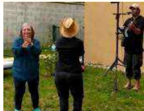
Dans des jardins