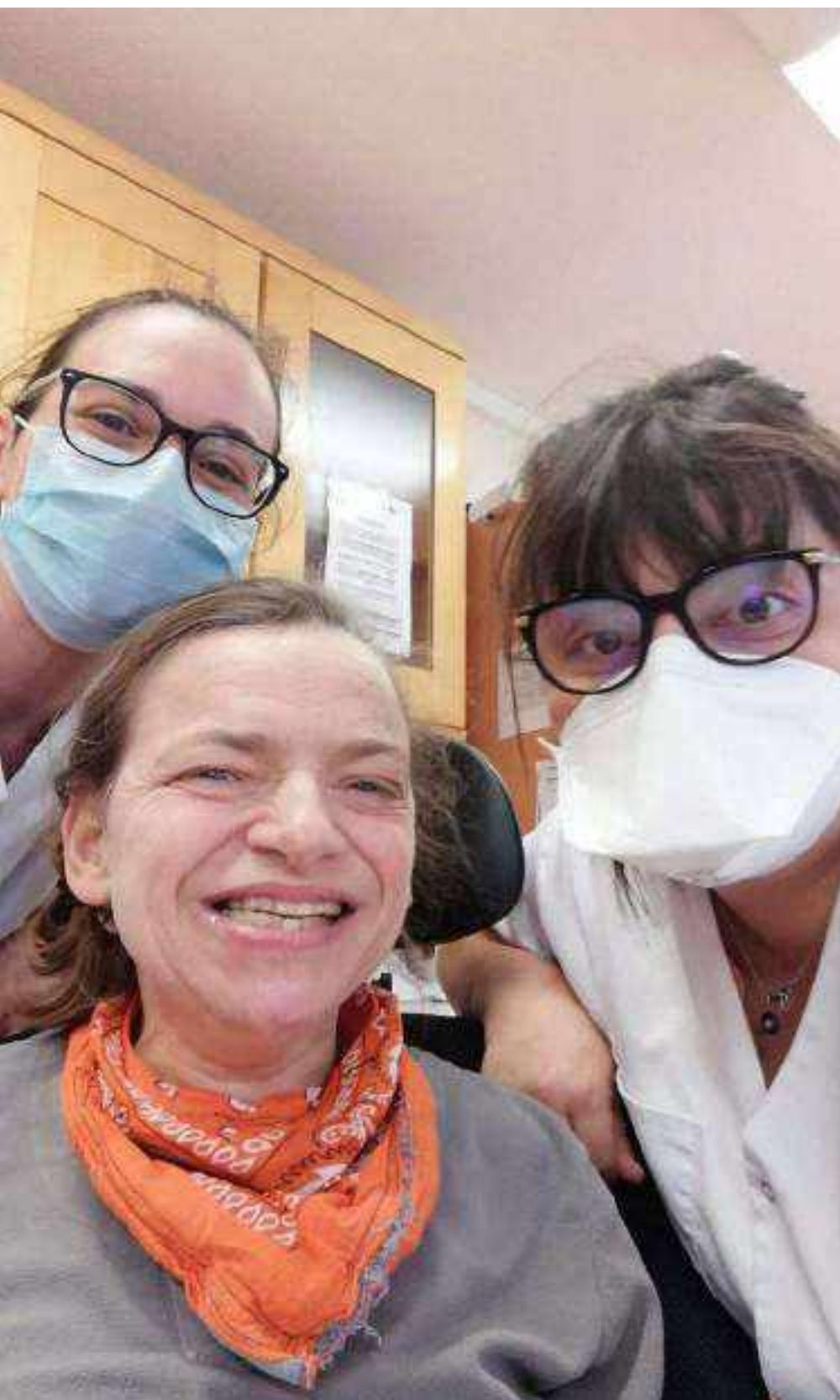
Des professionnels et une habitante du Goeland heureux de passer un moment en musique