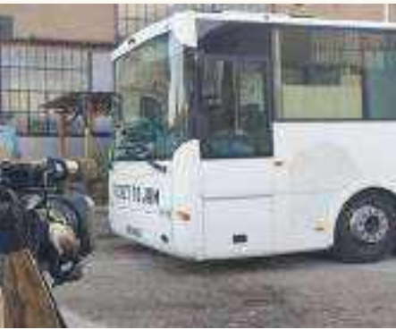
Le Bus TICKET TO JAM à BARBERAZ pour nous