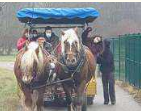
Une matinée de calèche, papillottes et concert pour l'IME de Challes-les-Eaux