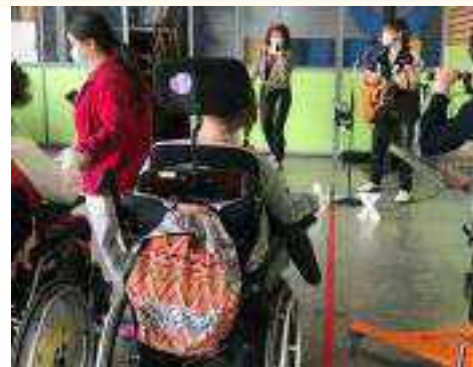
Un concert de ManMax pour les jeunes de l'Accueil Savoie Handicap