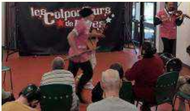
4 spectacles de nos amis Les Colporteurs de Rêves offerts pour des adultes et enfants en situations de handicaps