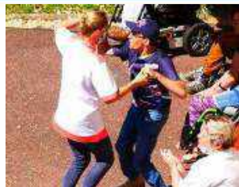
Les professionnels sont exceptionnels