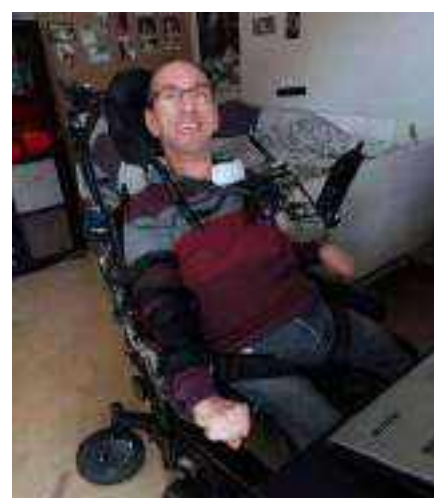
Les adultes du foyer Les Parelles à Challes les Eaux avaient sorti l'écran géant. QUELLE CLASSE