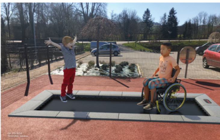
Trampoline au ras du sol pouvant accueillir les enfants valides et en fauteuil roulant.