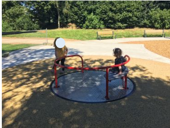
Tourniquet pouvant accueillir les enfants valides et en fauteuil roulant.

Aire de jeux avec rampe pour un accès à TOUS